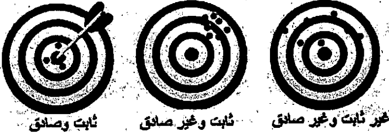
شكل (٣) العلاقة بين الثبات والصدق

والشكل التالي يوضح العلاقة بين الثبات والصدق (Shuttleworth, 2013):